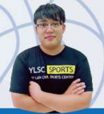
阿男教練 體適能指導員初級 兒童能量營籃球教練 C級籃球教練證