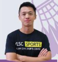
世豪教練 C級羽球教練證 B級輕艇教練證 C級游泳教練證