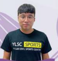
延安教練 C級羽球教練證 大專羽球專長生 宜蘭縣飛盤代表