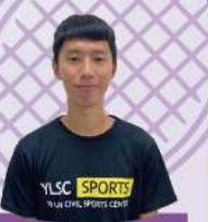
育震教練 C級羽球教練證 大專羽球專長生 B級游泳教練證

關於團報 ● TRX/空瑜/肌力/幼兒課程五人即可團報 ● 團報報名成功後，若於開課前異動，未達人數標準則以其他優惠計