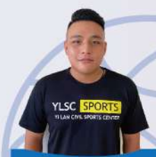
阿波教練 籃球全國甲級冠軍 自強國中籃球校隊 C級籃球教練