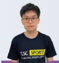
俊逸教練 中華羽協B級教練 竹林國小羽球隊外聘教練 飛嘉盃混合雙打冠軍